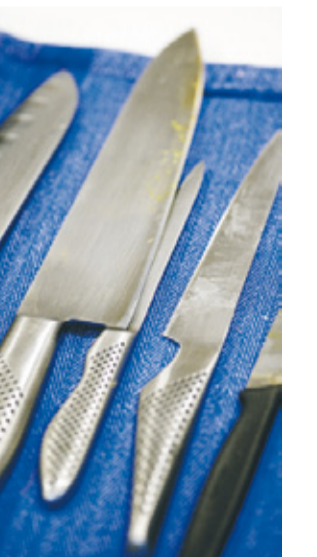
Gamla köksknivar räknas som grovavfall.